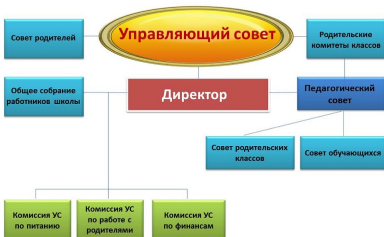
«Модель Управляющего совета ГБОУ СОШ N000»

Управляющим советом для выработки тактики и стратегии дальнейшего развития образовательной организации.